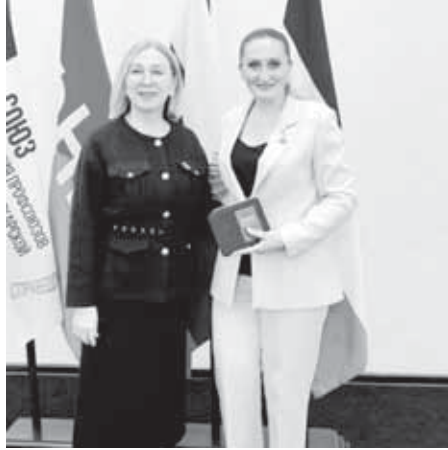
Чыгъама. Ол жыйрыгымы, кесими да махтаиды. Алай бла театрга ишлериме ыразылык бередилене», – деп эсгереди кызы.