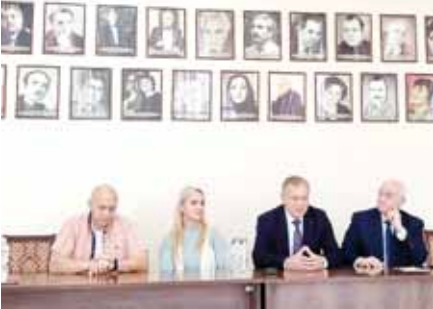
Гнесинле атлы институтта усталыгымы өсдорго, – дегенди. – Музыка театры иши да заманга кере торленген этеди, биз да

кыруда бир кибик жырмайбыз, ауазны амаллары кёндюле, аланы барысын да ачыкларга итине-бия».