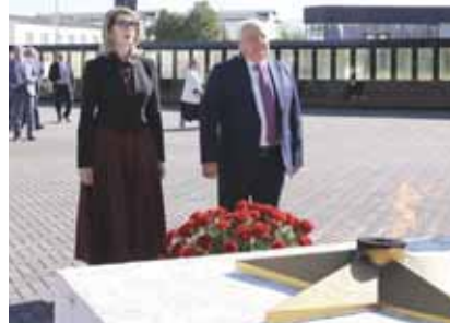
Объект барды. Он санда футбол стадиона бла комплекс, стадиона, футбол майданла, башка жерле. Аладан бирлери спортну битеруссий тимесине окунуа кийиргенди. Алай бла уа алада даржалы эришуле бардырылганы болукчуду, - денгеди спикер.

Биогонюкде уа регионда 1700 спорт мекми барды, аладан 54,3 проценти элдеде орналанды. 75 спорт объекттен, 2018-2024 жылда миллет проекткени чеклерине иштелингенден, 47-чи элдеде орналдыла. – Зольск району бошдан сайламанбыз бу магналаны соруну сюзере. Республиканы арасында узакда болганылыгы, мында жетишимле келдило. Аланы хайырындан а спорт инфраструктура да кыралганды. 16 элде 108 спорт