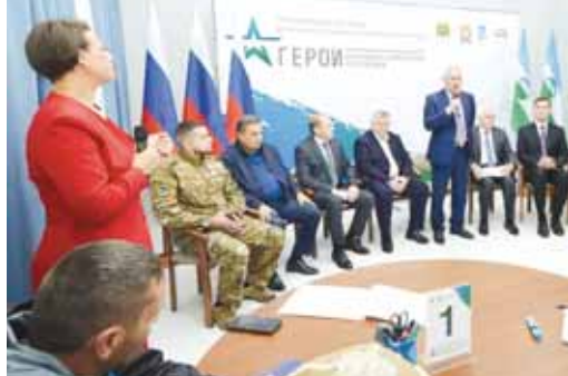
РАНХиГС-ны келечилери, регион вуздандан, властыны кырал эм муниципал службаларында специалистере да кытышканды. Окууланы биринчи урум 3 октябрье дерин бардыкы, ол кырал политиканы управление системасына эм бирге ишлеуно амалларына жоралганырыкыда. Айттыган темагы 502 сагат бёлкюно, ол кезинде ичинде айнырга себеллик этерик сейр эм магналаны дасре бериликкенди. Андан сора юйретиучиле ишге тохтаргыз болушуркы этериккенди.

Бу программаны жашауда бардырыу энчи аскер операциягы кытышкандыгы бла ветеранлагы усталыкларына көрө хайрыланууга онг берликке эм жамауат ишче, кырал эм муниципал службада да керек болукчуду. Окууга да кытышкандыгы аларында федерал экспертте, спикерде, тренере да бардыла. Андан сора да, бу программалык