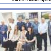
Гуртчилеге – майдагъала