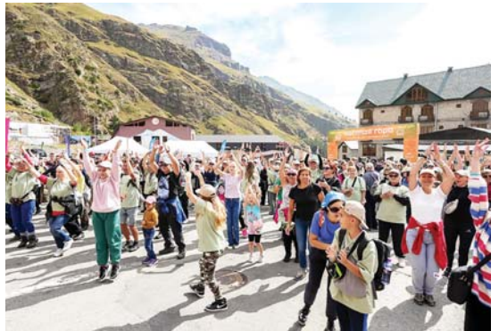
таза этген уллу байрамча кыалырга керекди», - деп белгилегенди Беккаланы Хайса.

«Таза тау» фестивалыны Кавказ. РФ айнытуу институт Къабарты-Малкъарны Правительствоосуна болушлугу бла кыураганды. Кавказ. РФ компания Россейни Эконо-