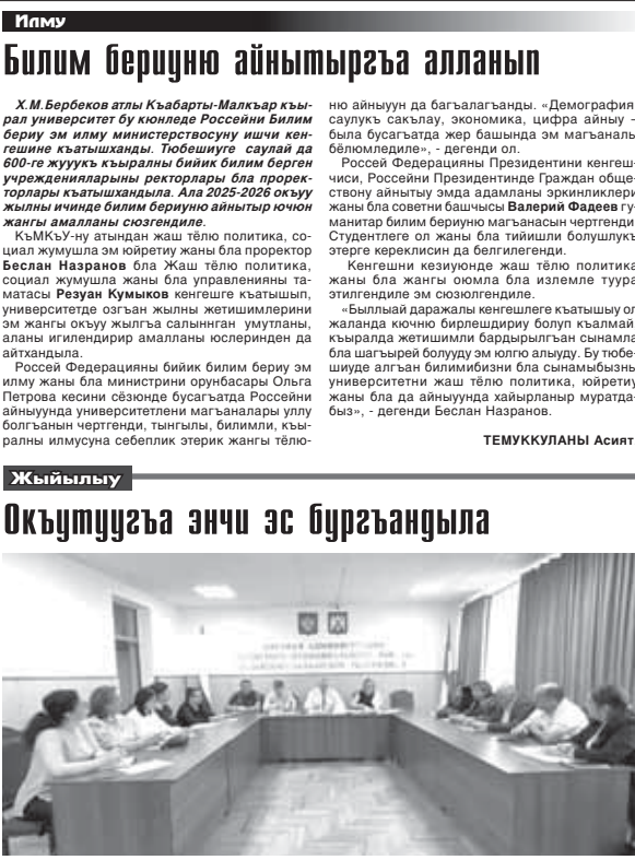
Черек району администрациясыны таматасы Кыубайланы Алан билим берую укредениларны таматалары бла стратегиялык кенеш бардырганды. Ала школаны жагы окуу жылга хазырыктыларын созилгенде.