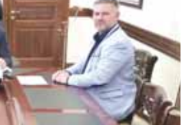
Ахыры 2-чи бетдеди.