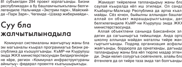
Жамауат тиьерлени тапландыруу жаны бла саууя кыралда көп иш этиледу. Ол санда Кыабарты-Малкяр Республика да артка кыалмайд. Сёз ючюн, былыны алланда башлап алай ол объект жарашдырылганды, деп белгилегендиге КыМР-ни Кыурулуш эмда ЖКХ министрствосунда.