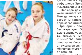
Эгеланы Алана бла Эльма.

Эгеланы Алана Тырнаузуада жашай-ды. Анга эм ариу катары кызы дегерге болушукъ. Бусагъатда ол жашауну халанда спорт бла байлар умутлауу.