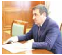
эмда биогонлюкде аны саулуғун къайтаруғуну мадарларын эте турдыла, деп билдиргенди КъМР-ни Башчысыны телеграм-каналында.

Тобешуину кезиунде сөз 4 июльда Нальчикде чабыуулукъ этилген жол инспекторга медицина болушлук къалай тапдырылганыны юсюнден да баргъанды. Врачла Азнаурну ёлкомден къутхаргандыла.