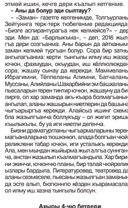
Ахыры 4-чо беттеди.

Арада полимер химия жаны бля специалитет ашуу болуп бля берилгенди. Жукуну заманда анда ишленген кандидатланда сора да, химия илмуланы докторлары болупкылары