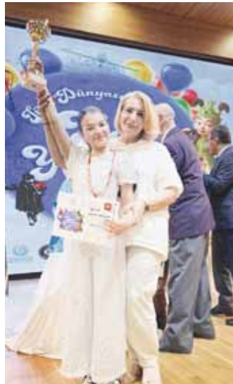
Додулары Индира бла Ахматланы Эльвира.

– Хар миллетни келечилери гимнлери согулган заманда миллет байракларыны алып чыгъа эдиле. Кыарын-