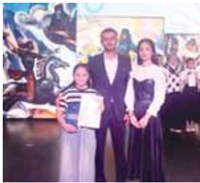
шарт а фестивал халкъла аралы даражагъа да чыгышканы кертюздеди. Хорлагъанлары саугъаларгъа келгенлени араларында КъМР-ни Жазуучулары союзуну