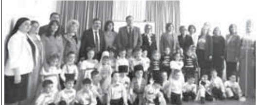
Владикавказдан специалистте да онгайыл халда кыошулгандыла.