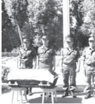
орус къабырлада, башха солдатланы къатларында аскер хурмет бла асырлаа деп онуу этиледи.