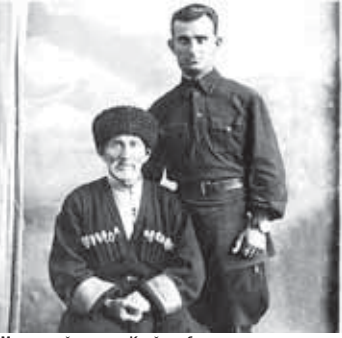
Мырта къыйн атысы Къыйсын бла.