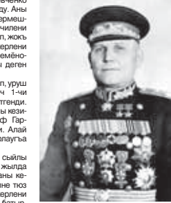
номерли) бла сауыланган эди. 1945 жылда 20 январьда Ковев Одерге чыгыра, февральда ол Ник-

Совет Союзу Жигити деген сыйлы ат Ковевни биринчи кере 1944 жылда 28 июлда «...улуу операцияланы керуунде фронталык аскерленин кыз башчылык эттени, душман аскерлени улуу кыаууу жок эттени эм батырлык...» ючюн берилгенди. Март айында уа совет аскер саугаланы арасында бла даражалы «Победа» орден (4-чю