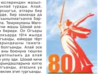
Газетни бетлеринде Улуу Ата журт урушга кытышхан кеп жерлешлерибиз-