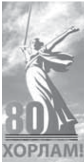
Саягатын ичинде фашистте ол дуплурну кырууларга деп орнаткан топлары жок этпген эди.

Бир кесекден Гуду ул кулдук эткен аскер бөлүмге камак тауаны тийрелерине тиширге буйрук келди. Кыбан сууга дери келди-ле. Көпкор бузулу турганы болуп, понтон көбүрө ишпел, аскер саугуларын бири жанына өтдөрүлдө. Ала Туапсе шахары кыруу-уларга көрөк эдиле. Аскер бөлүм турган жерди унаа бармай, дуплур башындан шахар поз көп аздача алай көрөнеди. Ол себеден аны