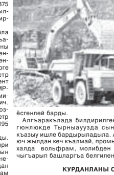
өсөткени барды. Алгачкыларда билдирилгенде, биогенлюке Тирьнаууда сынуа халда кызауу ишле бардырыладыла. Анга көрө, юк жылдан көч кыалмай, промышленный халда волфсрам, молбөндөн эм алтын чыгарыны башлагарга белгиленди.