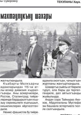
адамла оюлган, чачылган жетилеу жангырчаны Шахарга сыйлап ат бериле туруп, ала бары да тергелгенди, деп айткылганы жыйылууда.