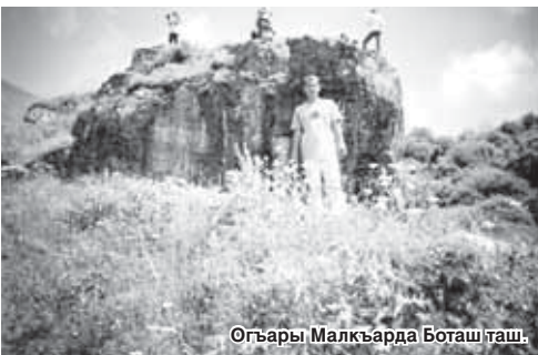
Огъары Малкъарда Боташ таш.

Бир жол Абайлары жыйылгандыла да, Боташланы кырутургъа деп оюу этгендиле. Аны уа Абайлары кеслеринде бир эсли жашчык эшитип турганды. Аны Боташладан бир аламан тенги билганды. Ала заманларын бирге ётдюргендиле. Бирге ашык ойнагандыла, агъач атларына минип чапхандыла. Бир кыабынны экиге юлешип тургандыла. Бир бири юйлерине да кеп барыучу болгандыла.