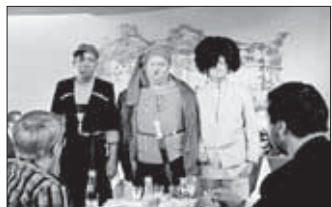
Материалы полосы подготовила Л. Михайлова.