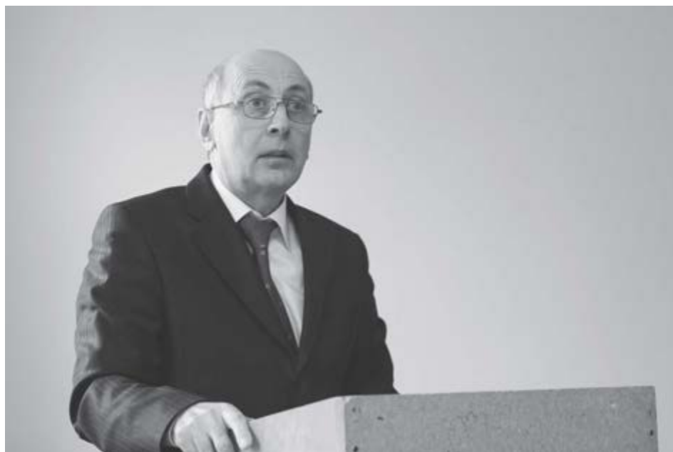
ЩIэныгъэ конференцэм кыщопсалъэ. 2018