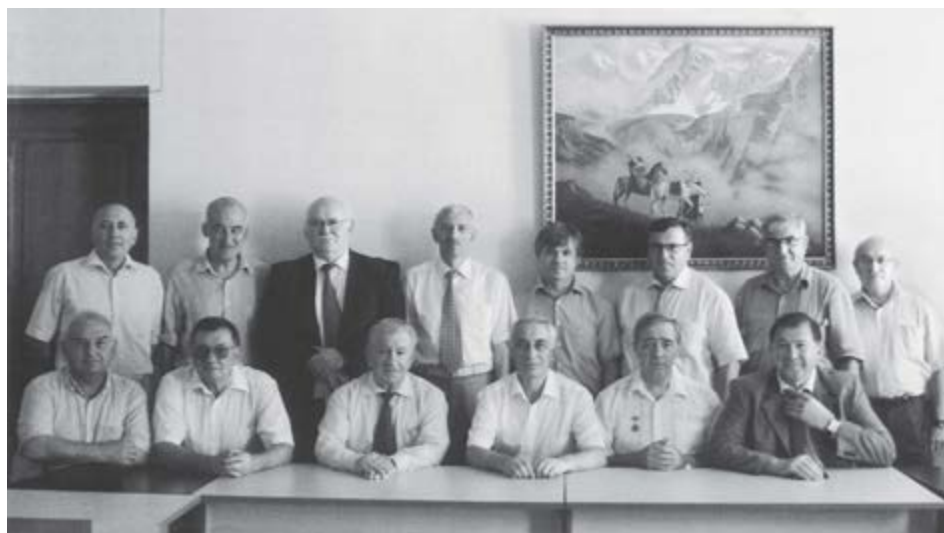
Къэбэрдей-Балькъэрым Гуманитар къэхутэныгъэхэмкIэ и институтым щылажьэхэмрэ къахуеблэгъэхэмрэ. 2014