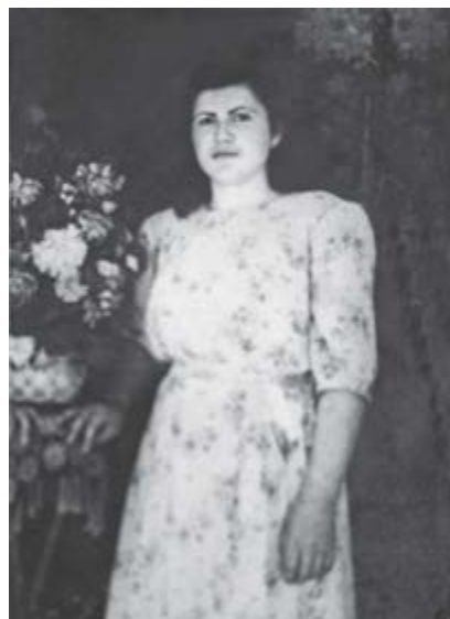
И анэ Хьэлимэт