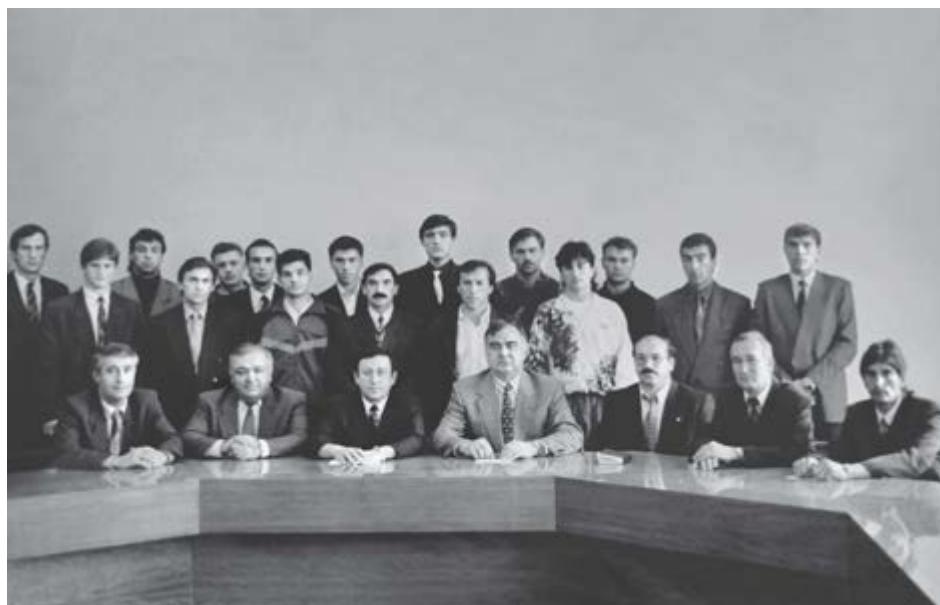
Къэбэрдей-Балъкъэр Республикэм и Япэ Президент КIуэкIуэ Валерэ, вице-президент Губин Геннадий, Къущхьэ Амырхъан сымэ «Спартак»-м и футболитхэм яхэсщ.