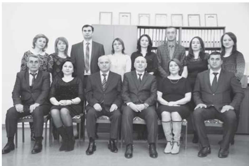
КъБКъУ-м и социальнo-гуманитар институтым адыгэбзэмрэ адыгэ литературэмкIэ и кафедрэм и лэжыакIуэхэр. 2022