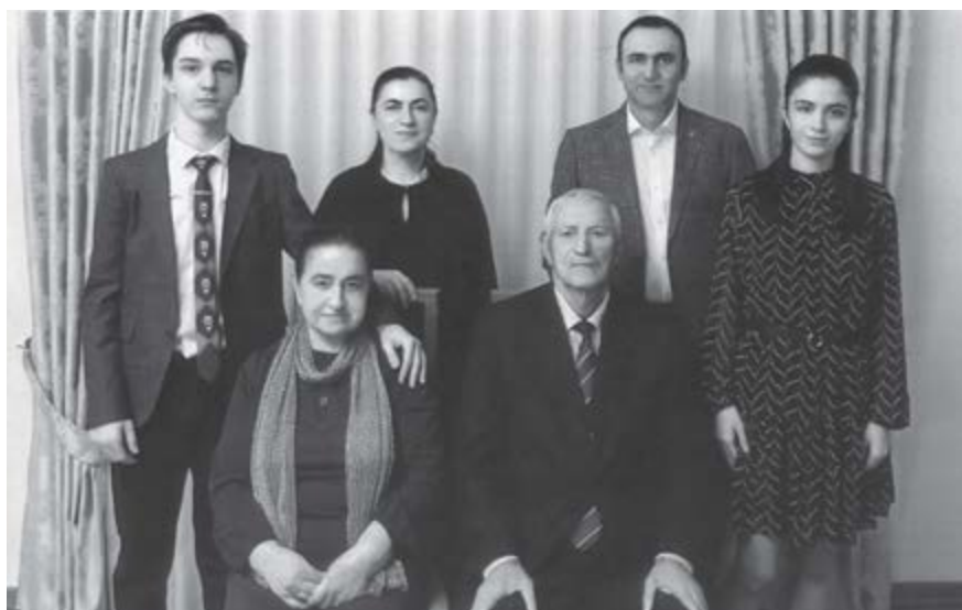
Хьанджэрий и унаггүэм яхэсу. 2025