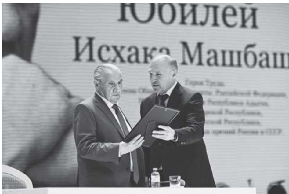
Сурэтхэм: МэшбацIэ Исхьэкь цагьэлыапIэ пшыхьым. Мейкьуапэ. 2025