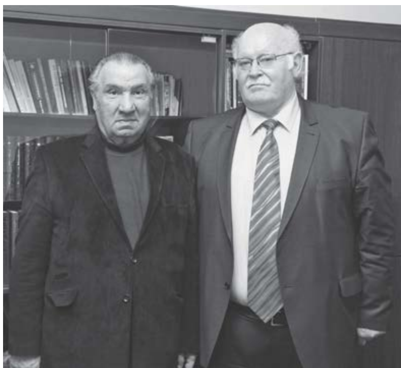
Мэшбацлэ Исхьэкьрэ Хьэфьцлэ Мухьэмэдрэ.