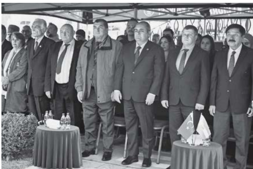
РФ-ни бла Тюрк Республиканы гимнлери айтылгъан кезиу