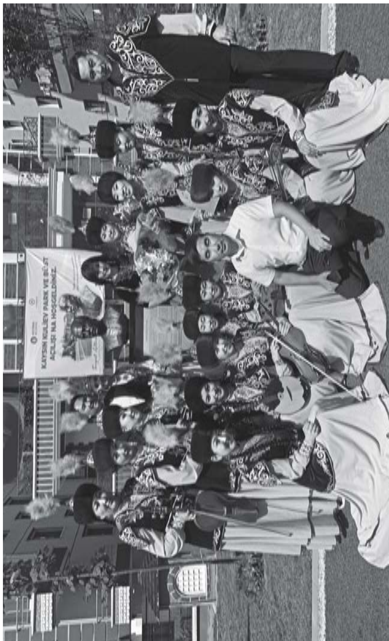
Қазақстанның Құрманғазы атылы қағырал академиялы халқ оркестри бла жыртөпсеу қауууу