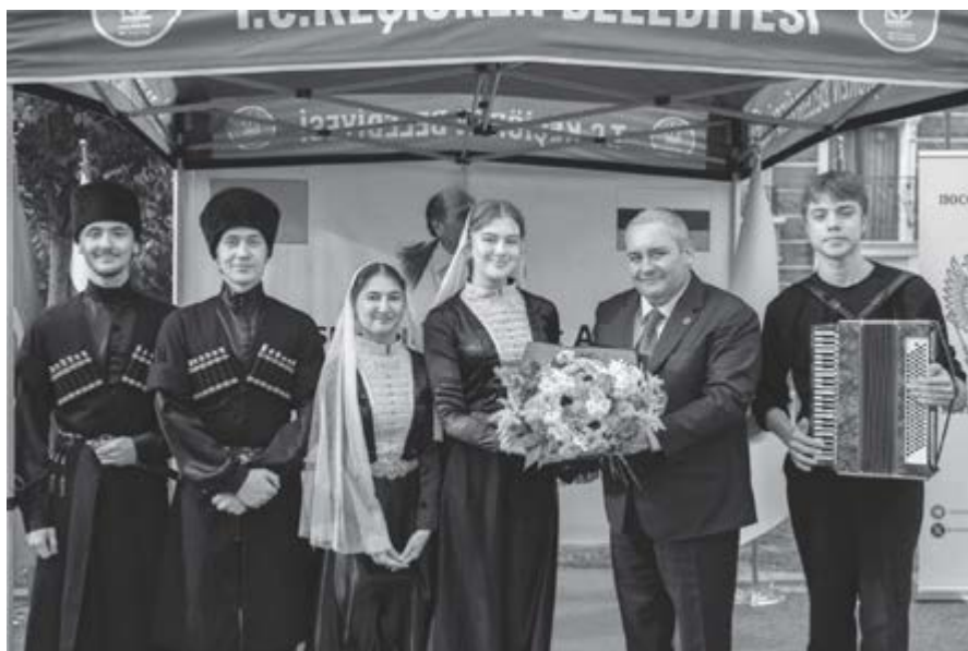
Анкара шахарны «Эльбрус» тепсеу кѡаууму