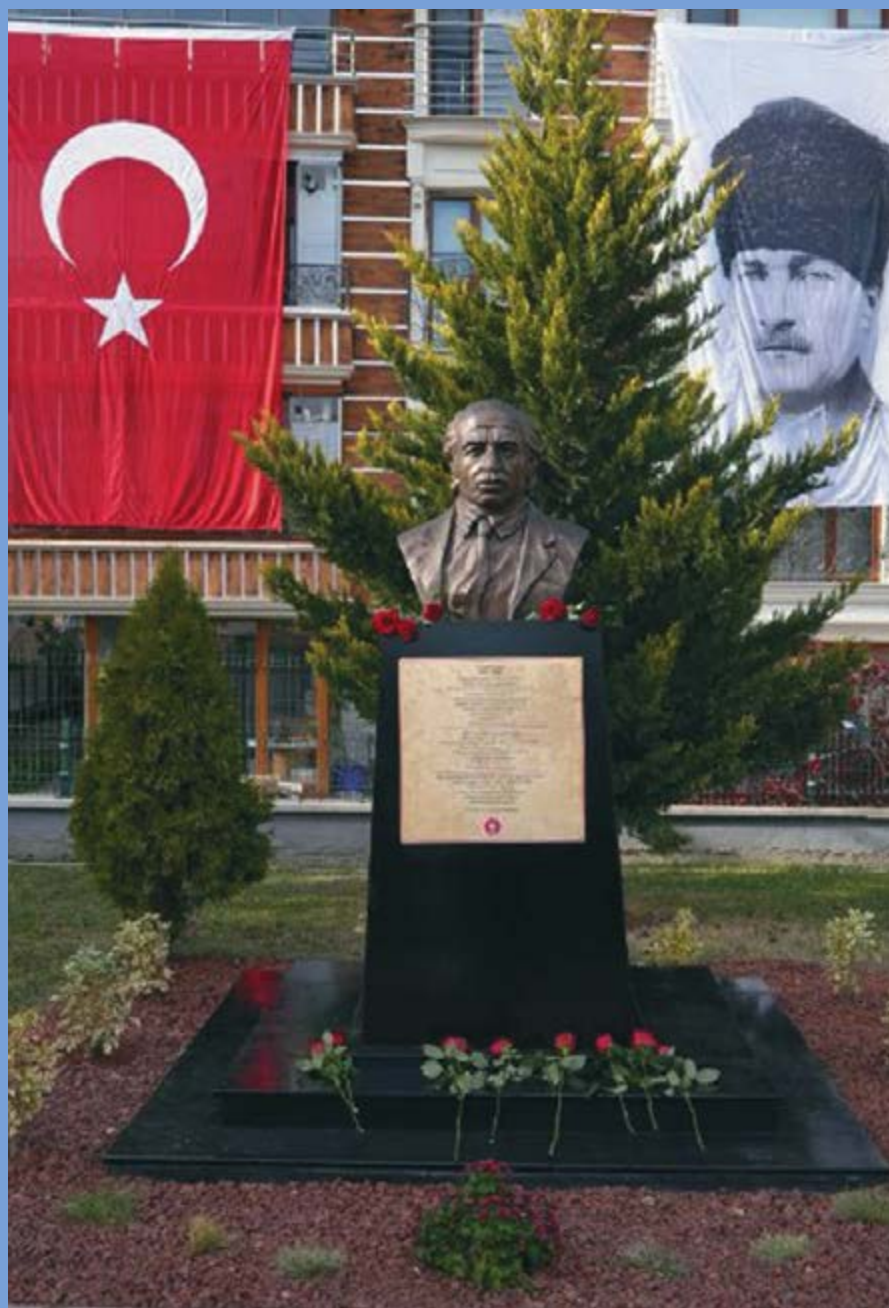
АНКАРАДА КЪАЙСЫН АТЛЫ ПАРК 2025 жыл