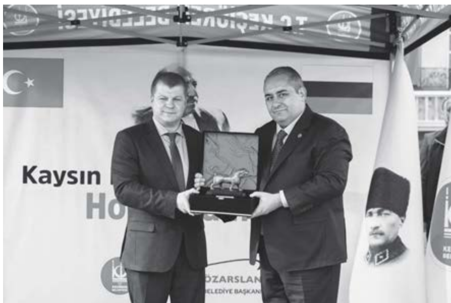
Росейни Тюркде посолу Алексей Иванов бла Кечиоренни мэри Месут Ёзарслан