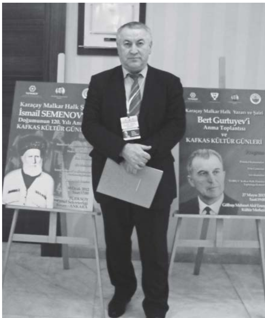
Къулийланы Къайсынны доммакъ бюстун Анкарагъа келтирген Гербекланы Нюрлю