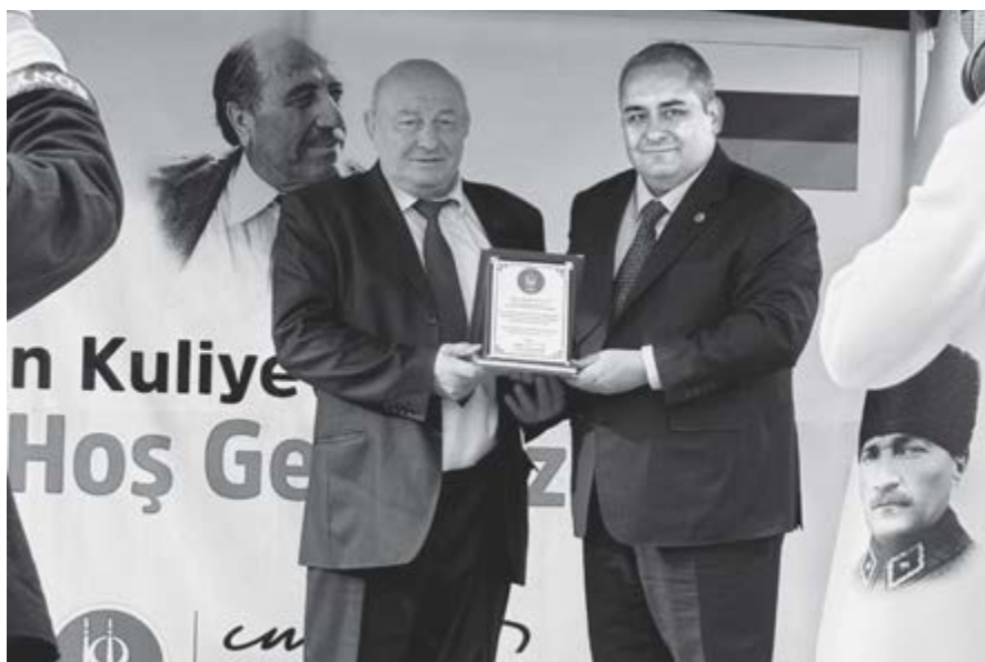
Додуланы Аскер бла Кечиоренни мэри Месут Ёзарслан