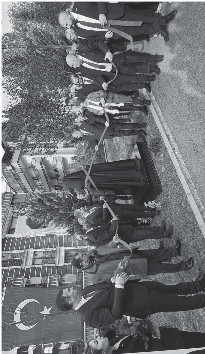
Эсгермени ачыла тургъан кезиую