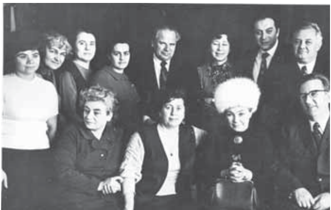
Коллектив «КБИ». Конец 1970-х годов