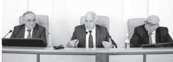
Министр экономического развития КБР Борис Рахаев выступил с прогнозом социально-экономического развития республики на среднесрочный период, который является основой формирования проекта республиканского бюджета.

Министр экономического развития КБР Борис Рахаев выступил с прогнозом социально-экономического развития республики на среднесрочный период, который является основой формирования проекта республиканского бюджета. Традиционно документ разработан в двух вариантах – оптимистичном, который характеризуется