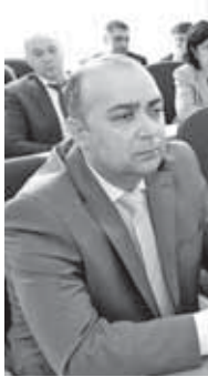
В ходе публичных слушаний рассматривались вопросы финансирования мероприятий по развитию экономики республики.

высокой инвестиционной активностью и успешной реализацией ряда крупных инфраструктурных проектов, и базовом. Второй характеризует параметры развития экономики республики при сохранении основных тенденций социально-экономического развития.