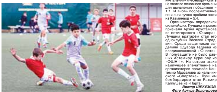
Итоговая таблица Группы 1

В первой группе юные спартаквцы выиграли оба матча («Юность» – 2:1, «ФШН-2» – 4:0) и уверенно шагнули в финал. «Юность» в матче против «ФШН-2» одержала победу со счётом – 2:0, что должно было бороться за бронзу. Во второй группе нинграты оказались закрученными в преддверии. В своих матчах против «ФШН-2» добились побед и «Нарт» (4:1), и «Юниор» (2:1). Победители группы определились в матче команды Пятигорска и Черкесска. При обычном формате «Нарт» достиг бы победы, но в этом турнире ничьих не бывает – сразу пробиваются пенальти. Победитель получает два очка, проигравший – всего одно. В матче «Нарт» и «Юниор» также дошло до пенальти.