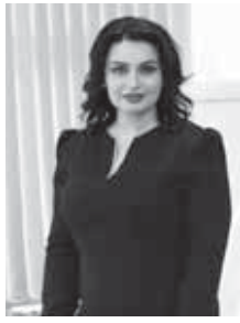
нальные советы оказались бесценными, – признаётся педагог.

Она запомнилась мне как человек, способный увидеть перспективу и внешне оптимистично. Её поддержка и професси-