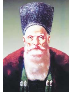
Михаил (Алей) Алегукович

В апреле 1676 года Черкасского отозвали в Москву. В период второй русско-турецкой войны (1672-1681 гг.) князь Михаил Алегукович Черкасский стал первым воеводой Большого полка и во главе русского войска выступил к Киеву. В 1679-м, предводительствуя многочисленным войском, Черкасскому удалось удержать турок и татар от вторжения на Украину (в Киев), при этом нанеся им значительный урон под Киевом. Осенью того же года Михаил Алегукович вернулся в Москву. За заслуги перед Отечеством был пожалован боярским саном, стал членом Государственной Думы, и ему было дано право «писаться» наместником казанским «при дипломатических сношениях». Особенно возросла роль князя Черкасского после воцарения Петра I. Для Азовского похода Михаил Алегукович на собственные деньги построил корабль, который царь Пётр считал лучшим во флотилии. «Если Пётр I пока ещё играл в «потешные», то его сторонники, и особенно М.А. Черкасский, уже стремились