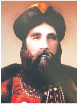
Дмитрий (Канша) Мамстрюкович

В 1612 году Иван Борисович Черкасский принял активное участие в освобождении Москвы от иноземных захватчиков. А в феврале 1613 года на русский престол при активном участии Ивана Борисовича и Дмитрия Мамстрюковича Черкасских взойшёл первый представитель новой царской династии Романовых Михаил Фёдорович,