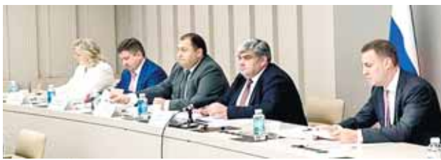
дарственных ветеринарных служб. По итогам совещания Дмитрий Патрушев поручил своевременно

Регионам предоставлен весь необходимый инструментарий для обеспечения эпизоотического благополучия, в том числе методические рекомендации. Комиссия участвует и в совершенствовании регулирования отрасли. Так, издан план ветеринарной безопасности, включающий порядок действий для профилактики и в случае возникновения болезней животных. В приоритете сегодня – системное наращивание эффективности госу-