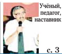
Учёный, педагог, наставник