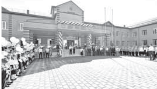
Новая школа в Баксанском районе

В общей сложности на реализацию мероприятий по комплексному развитию