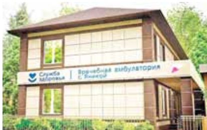
Врачебная амбулатория в с. Янкой

ние увеличивается с каждым годом. Кроме того, государство взяло на себя основную часть расходов по проекту социальной газификации, запущены программы «Земский учитель» и «Земский доктор», ве-