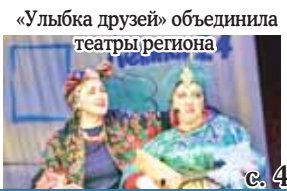
«Улыбка друзей» объединила театры региона