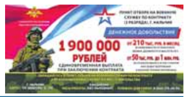
1900 000 РУБЛЕЙ