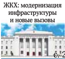
ЖКХ: модернизация инфраструктуры и новые вызовы