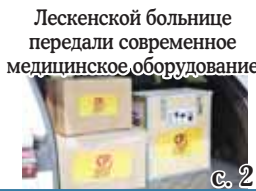
Лескенской больнице передали современное медицинское оборудование