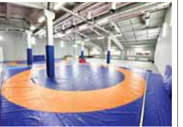
Строительство спортивного комплекса «Пять колец»