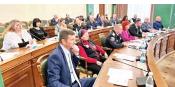
Заседание Совета по вопросам сохранения и укрепления традиционных российских духовно-нравственных ценностей