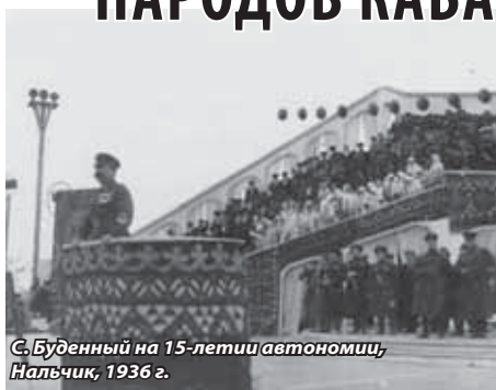
С. Буденный на 15-летию автономии, Нальчик, 1936 г.

1 сентября имеет важное значение для Кабардино-Балкарии, - говорит А. Кажаров. - В этот день в 1997 г. была принята Конституция Кабардино-Балкарской Республики. В связи с этим Парламент Кабардино-Балкарии своим постановлением от 1 сентября 1997 г. объявил эту дату Днем государственности (Днем республики).