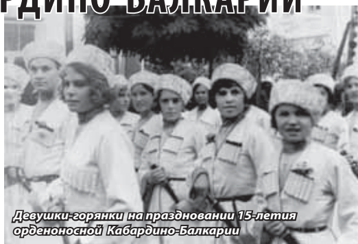
Девушки-горянки на праздновании 15-летия орденоносной Кабардино-Балкарии

также предпринимают активные шаги по сохранению и укреплению традиционных духовно-нравственных ценностей и развитию исторического просвещения. На уровне Кабардино-Балкарии приняты необходимые нормативные акты, при Главе Кабардино-Балкарии действует Совет по вопросам сохранения и укрепления традиционных российских духовно-нравственных ценностей.