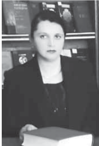
«Словарь синонимов карачаево-балкарского языка» (коллектив авторов) (2017).