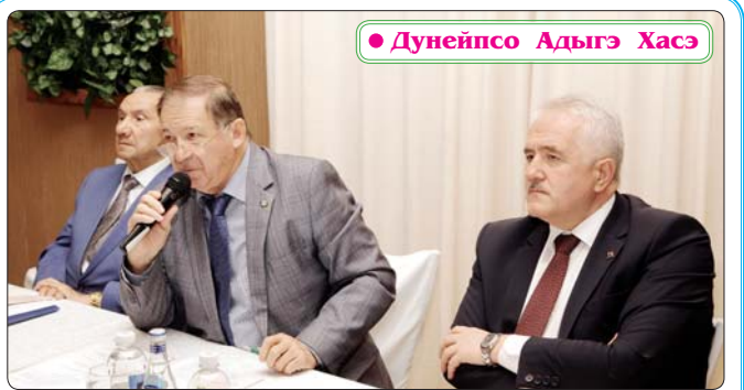
• Дунейпсо Адыгэ Хасэ