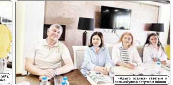
«Адыг псалъ» газетичым и лэжаклуэхэр лэтухэм шэпшэ.