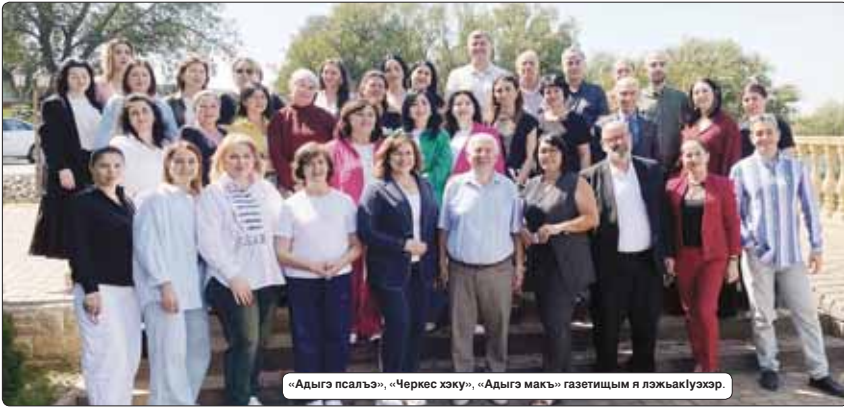
«Адыг псалъ», «Черек жэку», «Адыг макъ» газетичым я лэжаклуэхэр.