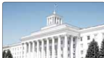
2025 гъэм Урысей Федерациэм и шцналэхэм яшшы 25-м, Къэбардэй-Балыкэрри ахуэ бюджет шыжухэр ятелым и процент 66-м нэблагъэр къэралым ахуэчыкынуццэ.

Зэлушцэм и гугуу шашцэ Налшык бадзэуэгумэ и 4-м къыщыкыуэ Іуэху мышхъэпэм фэбжь хэзыха, шцлэхэджашцэр зытеуа ДПС-м и лажыкыуэм хуащІэ медицинэ Іуэхуыгъэхэмкэ. Докхутыгъэм Азнаур къызарыгъэуэ-жыщ іджыпату и узыншагъэр зэрхэзтрагъэуэжымым иужь итц.