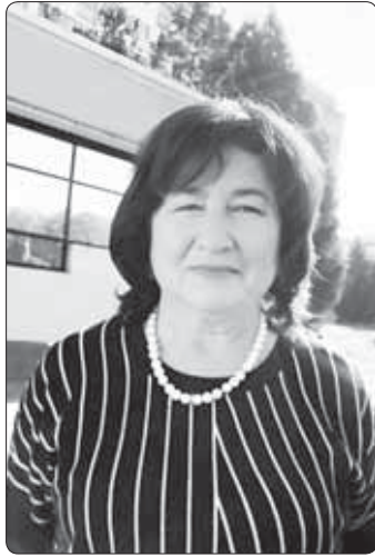
цэр кыздыкылауэ жэлэр.