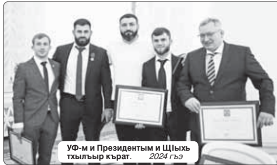
УФ-м и Президентым и ШЦыхь тхьлэр. 2024 гьэ