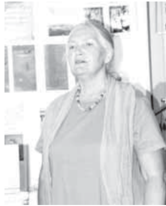
Мен анга Чегем районну Эл-Тюбу элинде ачыкъ кёкню тюбюнде «Къайсыннга жюз атлам» деген эсертме кыбыргъа ишленгенин айтып, аны көрсенг да иги болуп, дедим. Ол ары бармай къалмазлыгын айтханды.

Кертисин айтсам, бери тебирерни аллында Къабарты-Малкърны, аны халкларыны, адет-төрелерини юслеринден Интернетде окъугъанма, ол санда малкър халкыны зор бла кечюргенгени юсонден да. Малкър халкыны адабиятыны мурдурун салгъан Мечиланы Кязимге жоралап назму да жазгъанма», – деп, ол назмуны окъуду. Экибиз да мемориалны аллында сюелип, иги кесек заманлы ушакъ этгенбиз.