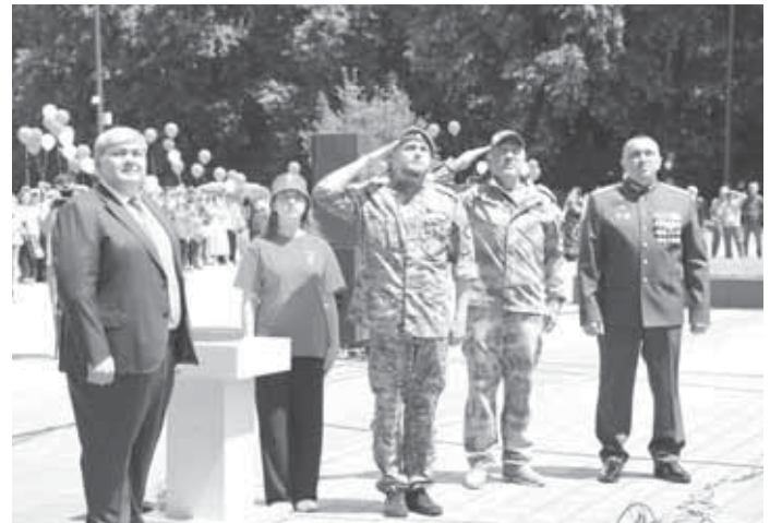
Герийланы Аслан онг жанындан экинчи.

Баш главнокомандующий а мамыр адамлагга сакъ болурга, бир инсан окуна бар эсе, ары от ачмазга буйрук бергенди.