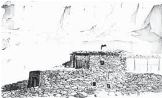
Шыкыда Хочуланы Таукашны юйю.