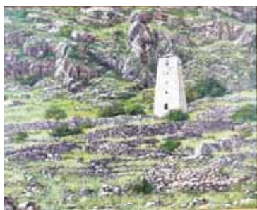
Абайланы Асият. «Огъары Малкър».