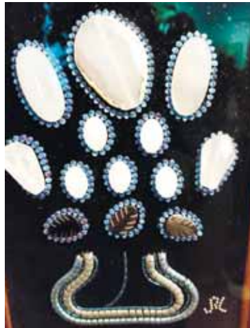
Узеланы Лидияны иши.

Бу кюнде «Кавказ» къонакъ юйде «Жаз башы» деген көрмюч ачылганды. Аны баш темасы тиширюну дуниясыды.