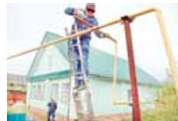
логия министрствотосуну кенгешинде да зоупотендиде. Анга районаны, шахарланы администрацияларыны эм дачала биригуню келечилери да кыатышкандыла. Жаңгы торленуилеге кер, республикада 7325 чакьль жер колошмо газ баша жалгытырга онг барды. Саулай алып айтканда уа бөлмюнюке дегенюнда 134 дачала биригуню саналды. Болсада газ тартырга жаруулууга аладан 59-чу төргөлдө.

Республикада жолда ююрюню жоюу автономизацияланган халда эсепте алган жаңгы б комплекс иштел башлаганды. Ала машинада кыоркуусу бауну такмаганыланы ачыккарыкыдыла, деп билдиргендиде бизге УГИБДД-ны пресс-службасындан.