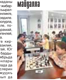
Кыраачай миллени жаңгыруу ююнне аталык Картачевск шахарда эркин туштуудан 2009-2010 жыллада тууган спортчуланы арзаланды эришүү кыраалгындан.

Кыраачай миллени жаңгыруу ююнне аталык Картачевск шахарда эркин туштуудан 2009-2010 жыллада тууган спортчуланы арзаланды эришүү кыраалгындан. Кыраачай миллени жаңгыруу ююнне аталык Картачевск шахарда эркин туштуудан 2009-2010 жыллада тууган спортчуланы арзаланды эришүү кыраалгындан.