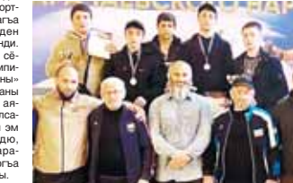
Кыраачай миллени жаңгыруу ююнне аталык Картачевск шахарда эркин туштуудан 2009-2010 жыллада тууган спортчуланы арзаланды эришүү кыраалгындан. Кыраачай миллени жаңгыруу ююнне аталык Картачевск шахарда эркин туштуудан 2009-2010 жыллада тууган спортчуланы арзаланды эришүү кыраалгындан.