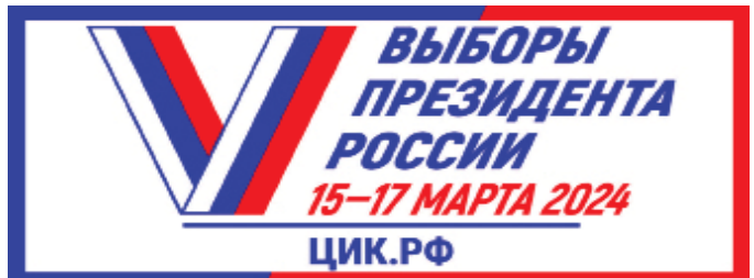
Агитационные материалы публикуются бесплатно на основании пункта 1 статьи 53 Федерального закона «О выборах президента Российской Федерации» (№19-ФЗ от 10.01.2003 г.)