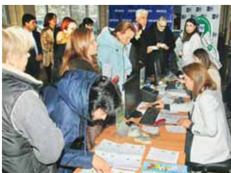
Газеты «Кабардино-Балкарская правда», «Официальная Кабардино-Балкария», «Адыг псалъ», «Заман», «Горняк», «Советская молодежь», журналы «Литературная Кабардино-Балкария», «Ошмамахо», «Минги Тау», «Сольнышко», «Нур», «Нор» посетили в кадетские школы-интернаты. Центр детской и взрослой неврологии и эпилепсии, Нальчикский психоневрологический интернат, Дом ребёнка специализированный, Онкологический диспансер, Республиканский социальное-реабилитационный центр для несовершеннолетних «Намыс», Специальный дом для одиноких престарелых.

Под аплодисменты аудитории первым сорвал листья-конверты с «дерева» председатель комитета Парламента республики по культуре, развитию гражданского общества и информационной политике Амырбий Теуев. От его имени газеты и журналы будут получать сотрудники и воспитанники Специальной (коррекционной) школы-интерната №3 Министерства просвещения и Информационно-коммуникационной связи КБР и Проходненского детского дома-интерната Министерства труда и социальной защиты республики.