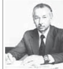
Составителем труда выступил ученый Марат Борей. Это уже третья книга, вышедшая в свет после смерти Рауфа Алиева.

— Р.А. Буряев родился в ауле Хабез Карачаево-Черкесии в 1933 году. Он автор более 250 публикаций. Один из первых в России представил научный компонент по специальности «Экономическая и социальная география» (книга, контурные карты, рабочие тетради, настенные карты, атлас).