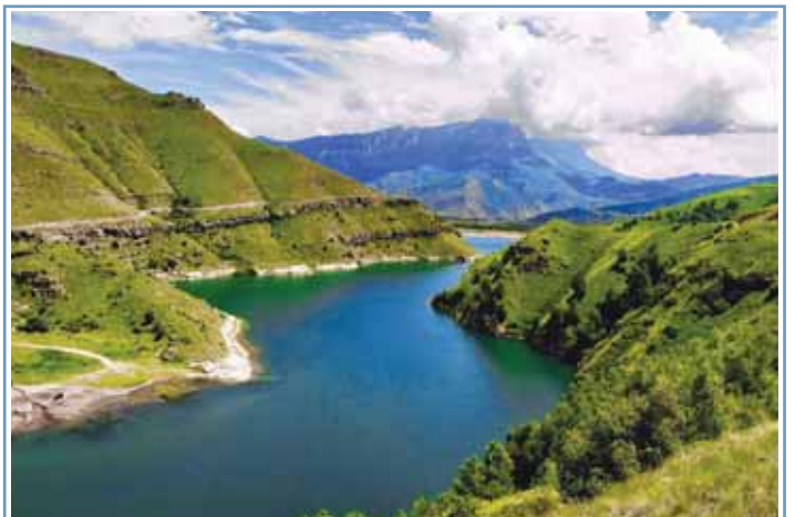
Озеро Гижит.

Зам. главного редактора Н.Ю. КОНАРЕВА Редакционная коллегия Р. Бажова (гл. редактор), Р. Туртеев (зам. гл. редактора), Л. Умарова (оте. секретаря), А. Асанова, М. Белгородова, Б. Бербекова, И. Богачева, А. Дышкоч, З. Малибахова