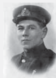
Абдулах Тхакумачев – советский морской лётчик-истребитель, участник советско-финской войны и Великой Отечественной войны

Июль 1969 г. – состоялся визит лётчика-космонавта СССР Алексея Архиповича Леонова в Нальчик.