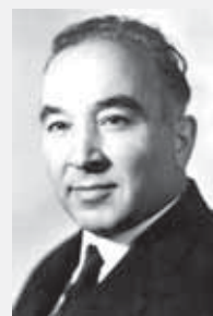
Писатель Алим Кешоков