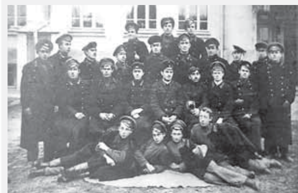
Выпускники реального училища им. Императора Александра III в слободе Нальчик. 1919 г.