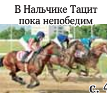
В Нальчике Тацит пока непобедим