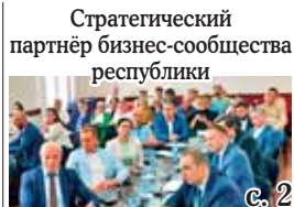
Стратегический партнёр бизнес-сообщества республики