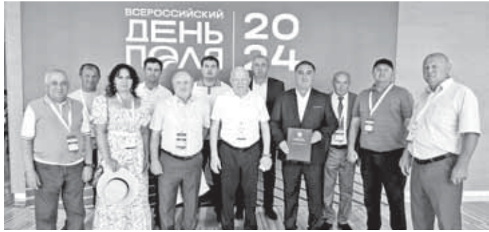
Делегация фермеров Кабардино-Балкарии

(Окончание. Начало на 1-й с.) – Вместе с тем к этому сроку предстоит решить новые амбициозные задачи, и для этого в Минсельхозе России разработали детальный план. Обеспечить увеличение производства и поставок за рубеж планируется за счёт следующих основных категорий: зерна, масличных культур и продуктов их переработки, мясной и молочной продукции, муки, сахара и кондитерских изделий. Важно указать, что приоритетными экспортными рынками для России являются дружественные страны ЕАЭС и СНГ, Ближнего Востока, Азии, Африки и Латинской Америки. Сейчас российское производство в