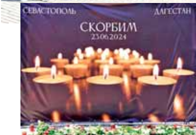
«Акция организована молодёжью. Этим ребятам выразили свою гражданскую позицию, своё несогласие с тем, кто сегодня пытается внести раскол в многоконфессиональное и многонациональное российское общество. Кабардино-Балкария разделяет горечь произошедшего и скорбит вместе с жителями братских регионов. Светлая память погибшим», – написал в своём телеграм-канале руководитель республики. У стийного мемориала со-