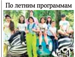
По летним программам