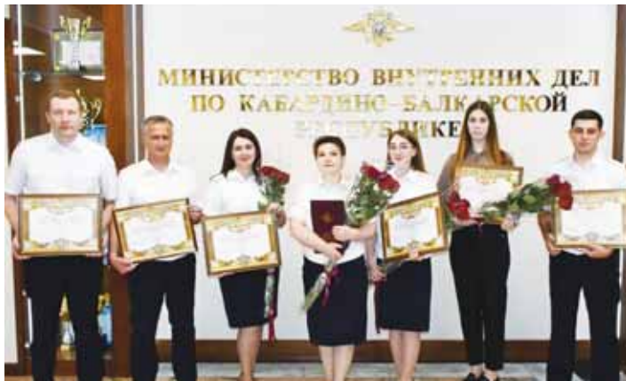
10 июня исполнился 41 год со дня образования подразделений, в задачи которых входит реализация информационной политики Министерства внутренних дел Российской Федерации.

История ведомственных пресс-служб началась 10 июня 1983 года: в структуре центрального аппарата МВД СССР было создано пресс-бюро. Подразделение занималось пропагандой деятельности органов внутренних дел, взаимодействием со средствами массовой информации и творческими организациями.