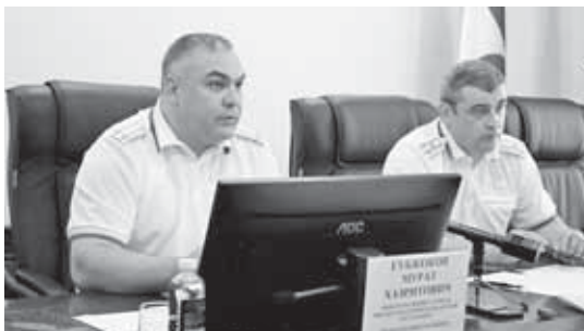
В МВД по КБР на брифинге обсудили вопросы обеспечения безопасности подростков на летних каникулах.

Как и в предыдущие годы планируется проведение профилактической работы с отдыхающими детьми, чтобы не допустить с их стороны правонарушений и преступлений. В прошлом году эта задача была успешно решена.