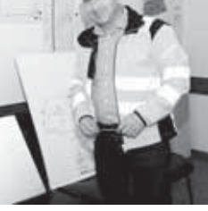
А самое главное – люди, которые были обучены и дождались возобновления деятельности предприятия. Мы в свою очередь ощутили свою ответственность перед ними. Всё это позволило после пятилетнего простоя и консервации буквально в течение трёх месяцев начать полноценную работу. Сегодня все мы одной сплочённой командой работаем над развитием завода.

оператором. Линия запускается и отключается с помощью программного обеспечения. И все остальные линии в большей или меньшей степени имеют примерно такой же высокий уровень автоматизации. Помимо уменьшения количества ручного труда, оборудование позволяет практически исключить влияние человеческого фактора на качество продукции. При этом мы все же считаем, что в этом деле важна роль человека, которое у нас имеется, – для района достаточно хороший показатель.