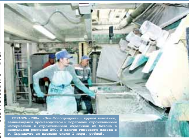
СПРАВКА «КБП»: «Эво-Зонпродукт» – группа компаний, занимающаяся производством и торговлей строительными материалами и строительными изделиями из бетона в нескольких регионах ЦФО. В выпуск гипсового завода в г. Тырнмаузе ей вложено около 1 млрд. рублей.

ническое перевооружение завода силикатного кирпича в гипсовый. На карьере провели вскрышные работы: если до 2010 года работали на ограниченном участке, то с 2014-го добыча могла вестись сверху вниз с помощью приобретённой современной горнодобывающей техники. Линию дробления вынесли с территории завода в границы карьера. Дроблёный камень загрузили в автосамосвалы и перевезли на производственную площадку. На заводе заменили линии по производству гипсового вяжущего, сухих строительных смесей, гипсовых плит, установили новое для российского рынка линии гипсовых панелей. До 2014 года все линии были запущены, люди обучены, завод проработал до 2016 года. Затем появились проблемы на рынке, маркетинго-