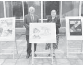
На выставке детских рисунков, посвященной Специальной военной операции, г.о. Нальчик, 2023г.