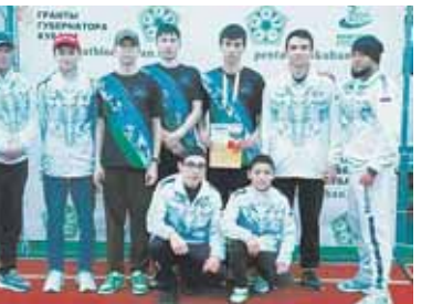
Следующим стартом для наших спортсменов станет первенство России, которое пройдёт в Челябинске с 25 по 29 февраля.