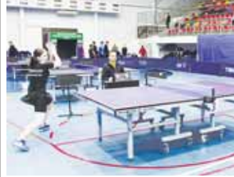
Материалы рубрики подготовил Альберт ДЫШКОВ

В спорткомплексе «Гладиатор» прошло юниорское первенство СКФО по настольному теннису.