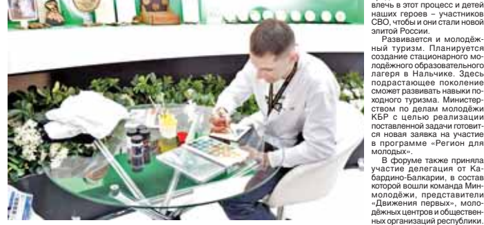
По материалам пресс-службы Главы и Правительства КБР

Казбек Валерьевич подчеркнул, что большое внимание уделяется подготовке квалифицированных специалистов по работе с молодежью. Только за прошлый год обучение и курсы повышения